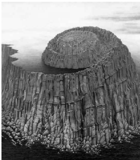
Trompe l'oeil « Tour de Babel », auteur inconnu (les deux)